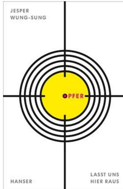
Opfer. Lasst uns hier raus. Aus dem Dänischen von Friederike Buchinger. Carl Hanser Verlag 2016. Lesung in der IJB: 19. Juli, 11.30 und 14 Uhr

Zunächst ist es ein ganz normaler Schultag. Doch auf einmal wird die Schule abgeriegelt, ein Zaun hochgezogen, Drohnen kreisen, es ist unmöglich, das Gelände zu verlassen. Niemand weiß, was los ist, und als eine mysteriöse Seuche ausbricht, die mehr und mehr Schüler und Lehrer dahinrafft, herrscht nackte Angst. In der Tradition von William Goldings „Lord of the Flies“ erzählt „Opfer. Lasst uns hier raus“ von einem Überlebenskampf auf isoliertem Raum. Und wie bei Golding finden sich die Schüler in zwei rivalisierenden Lagern zusammen: In einer Gruppe regieren Führerkult, das Recht des Stärkeren und animalische Instinkte,; die andere versucht trotz allem, humanistische Werte aufrechtzuerhalten. Der Roman schildert parabelhaft – dank einer individuellen Erzählstimme allerdings auch sehr plastisch –, wie viel Mut und Kraft dazugehören, Humanität in einer existenziell bedrohlichen Situation, in der sie unabdingbar ist, zu bewahren und zu verteidigen. (ab 13)